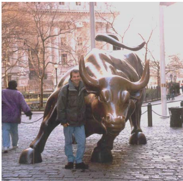
El autor junto al Toro de Wall Street (1998)

Al invertir en activos financieros es indispensable considerar bajo qué ley se encuentran amparados y en qué moneda se realizan, a fin de evitar la inseguridad jurídica y la depreciación monetaria. Además, como en todo cálculo de largo plazo debe tenerse en cuenta la inflación del dólar, tomada como moneda dura de referencia.